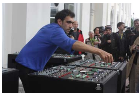
Metastable Circuit , performance de Tarek Atoui, 6 juin 2012, Kunstahalle Fridericianum, dOCUMENTA 13, Kassel.