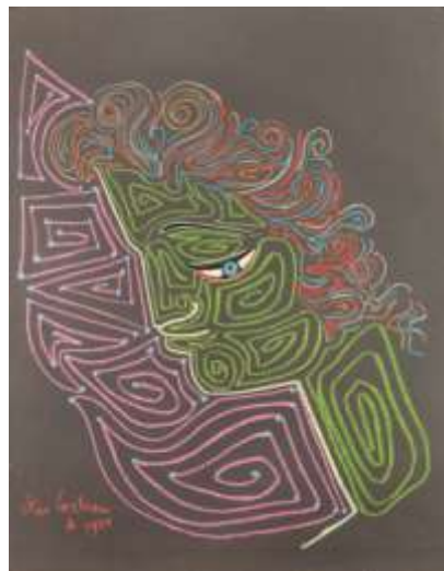
Grand profil aux arabesques – 1958 Pastel – 65x50 cm

Si l'exposition révèle l'évolution stylistique du dessinateur, elle met également en lumière les différentes techniques utilisées par Jean Cocteau. Du pastel au crayon gras en passant par l'aquarelle, la gouache, le stylo, l'encre de chine, la mine de plomb ou encore le marqueur.