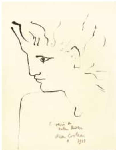
Profil gauche – Vers 1945 – Encre de Chine – 27 x 21 cm

Les œuvres de 1930 jusqu'à la fin des années 40, cristallisent le répertoire mythologique du poète. Apparaissent à cette époque les célèbres profils masculins comme Le Portrait de Jean Marais daté de 1940. Parallèlement, naissent ses créatures légendaires, hybrides entre l'homme et l'animal, telles que centaure, sphinx, griffon, sirène et illustrées dans cette exposition par cette encre de Chine représentant une Licorne réalisée vers 1947.