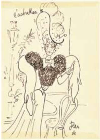
L'astrakan – Dessin pour le Figaro – Vers 1935 – Encre Noire – 25.4 x 18.2 cm

L'exposition organisée par la galerie Bert suit le fil d'Ariane du dessinateur. Centaures, nymphes, bacchantes, licornes, sphinx, légionnaires romains, Dieu Solaire ou encore Orphée y sont convoqués.