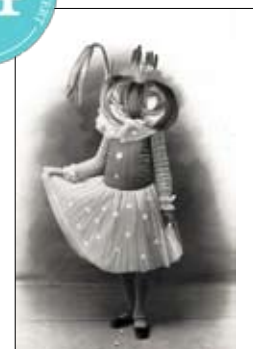
Jeune-fille en fleur