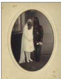
Mariés du cousin Machin